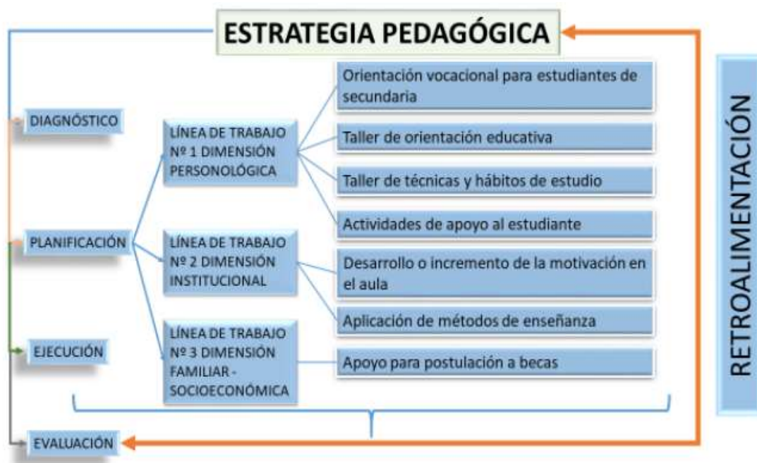
Figura 2. Esquema general de la estrategia pedagógica

La aplicación de la estrategia permitió identificar una disminución en la deserción estudiantil en los dos primeros semestres de la carrera, en comparación con gestiones anteriores.